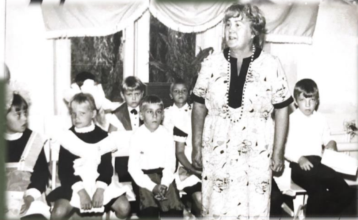
(даты неизвестны)