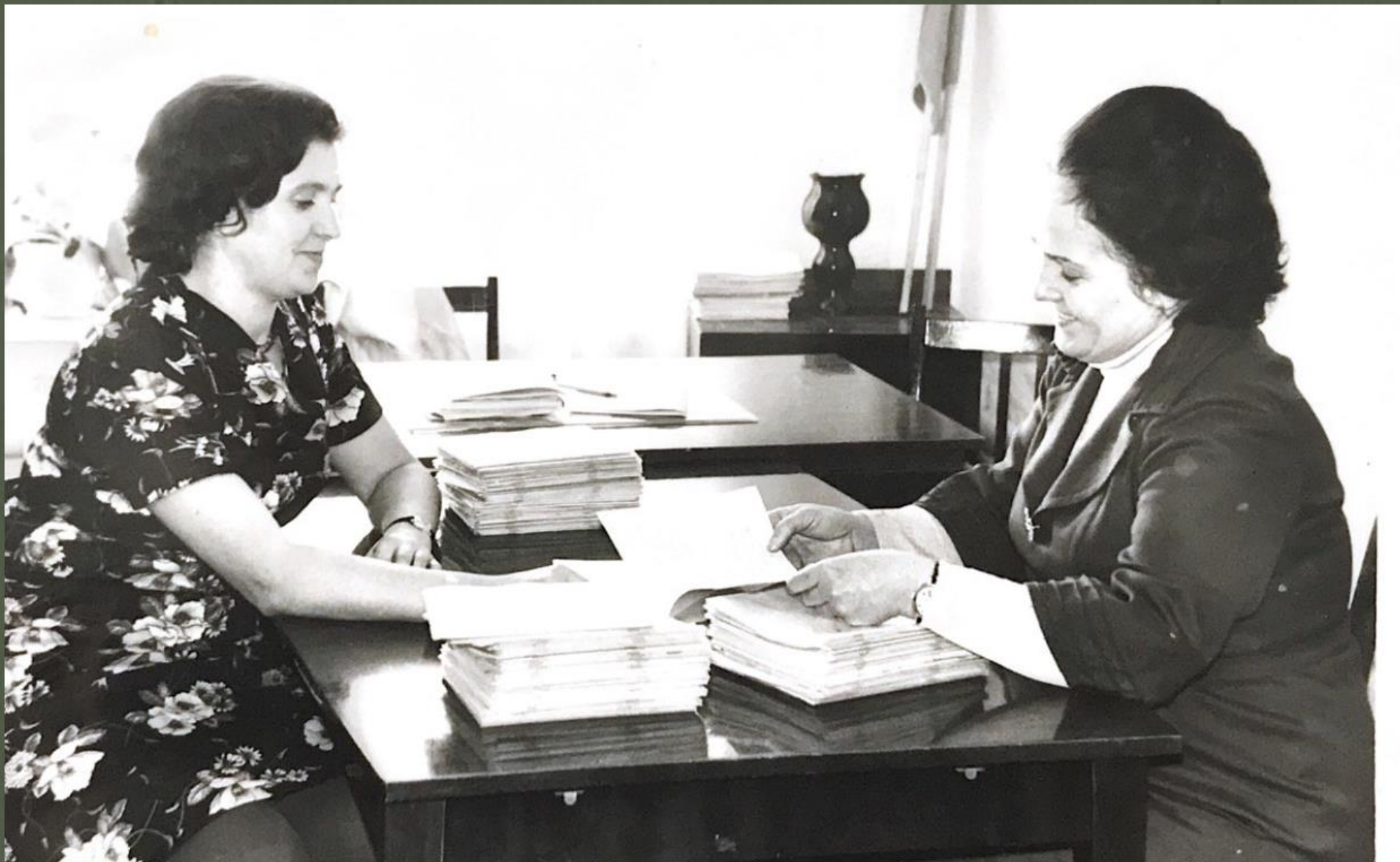
Фото из семейного архива Осокиной А.П.(дата неизвестна)